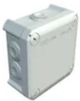
Kabelabzweigkasten T60 Bettermann lichtgrau, halogenfrei IP55-IP66